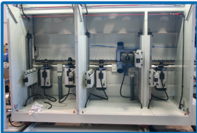
Struttura portante monolitica Monolithic structure; Base and Machinesides