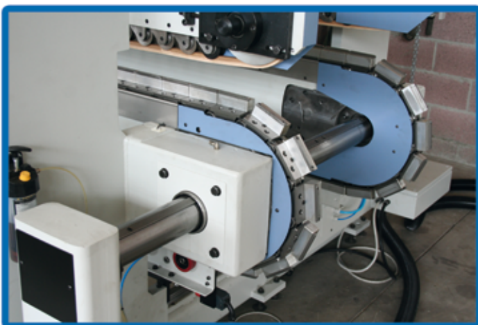
Cingolo a cuscinetti di precisione ad alta velocità High Precision - and Speed Chain Tracks CONTINUOUSLY ROLLING via bearings